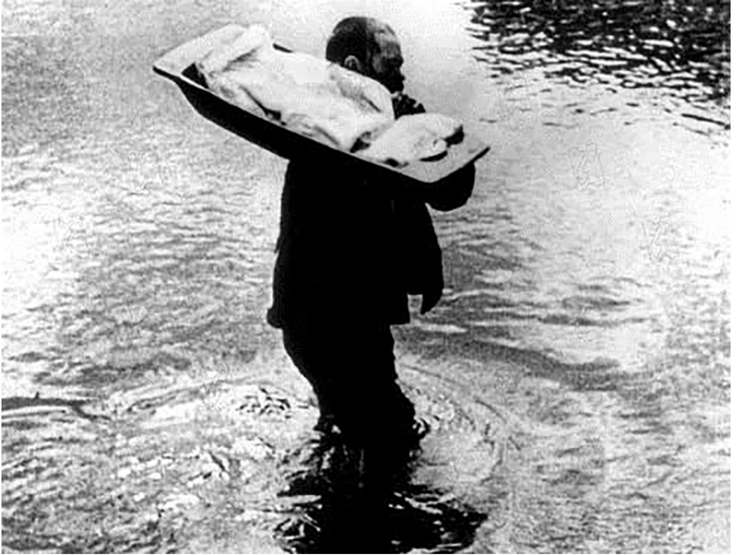
'La Hurdes, tierra sin pan.'