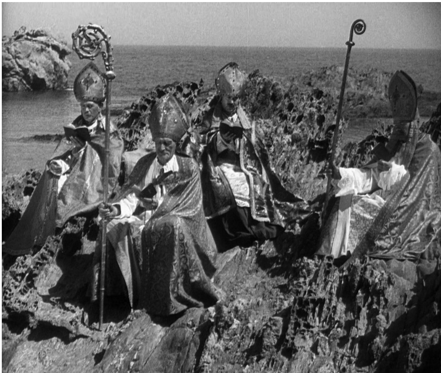
Seqüència de 'L'age d'or', de Buñuel i Dalí.