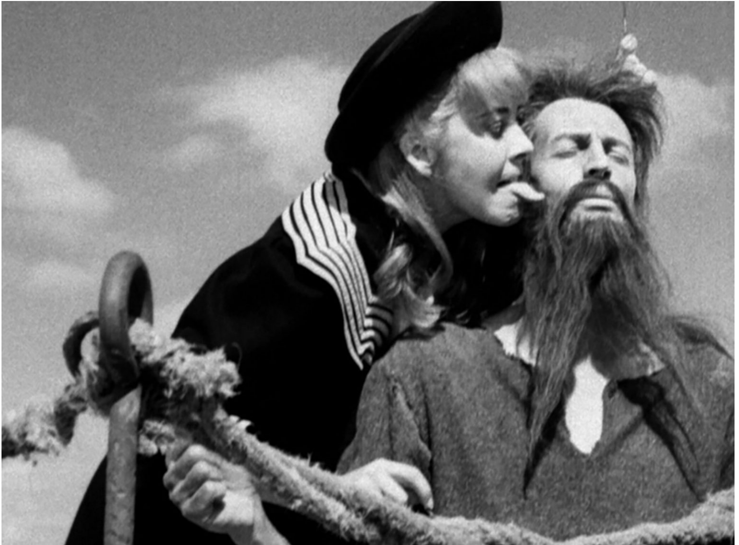
Fotograma de 'Simón del desierto'.

Obrero. Un dia, assabentat que el govern volia embargar-ne una edició, la va comprar tota sencera per impedir el segrest del diari.