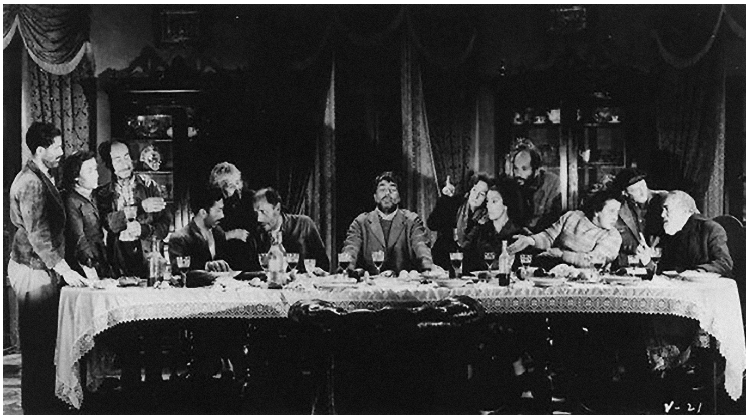
Viridiana, l'últim sopar.